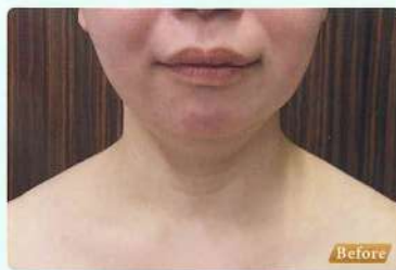
フェイスライン、首のシワ